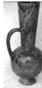
ش ۷: فرم خاصی از کوزه که در کارگاه کاشی ساخته شده است