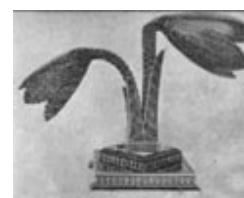
ش ۳: چراغ دوپایه که تماماً خاتم کاری شده است