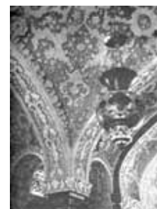
شکل ۲: طرح گچ بری نمای داخلی موزه هنرهای زیبا