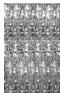
ش ۵: قطعه زری صورت دار که در کارگاه زری بافته شده