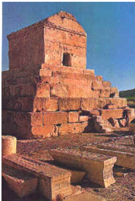
"Great Tombs" in Persepolis

البته ما باید استثناهایی هم برای ساختمان های چند شکلی که برای مواردی خاص استفاده می شد، قائل شویم. این گوناگونی برآمده از نیازهای خاص مردم در زمانهای متفاوت بوده است. هنرمندان ایرانی به دنیا ثابت کردن که توانایی های بالایی دارند و شامل احترام بسیار، بخاطر اثرهای تاریخی منحصر بفرد فراوانی که از خود بجای گذاشته، هستند.