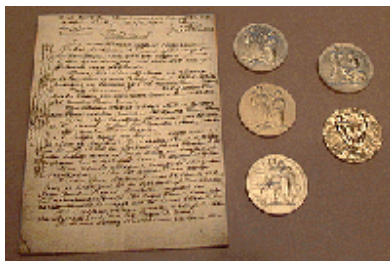
وصیت نامه نوبل

نخست آن را به کنسولگری «سوئد» در پاریس انتقال داد و از آن جا در بسته‌های کوچک به سوئد فرستاده شد. پول‌ها با تمام جزئیات خیال‌انگیز و اسرارآمیزشان، راه خود را به محل واقعی خویش پیدا کردند.