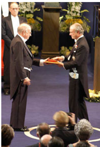
مراسم دریافت جایزه از پادشاه سوئد