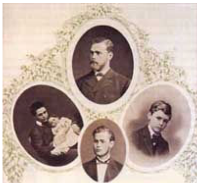
برادران نوبل (رُبرت، آلفرد لودویک و امیل)

«امانوئل نوبل» چهار پسر داشت به نامهای «رُبرت»، «لودویک»، «آلفرد» و «امیل» که همگی آنها از استعداد فنی قابل توجهی برخوردار بودند. «رُبرت» و «لودویک»، شرکت نفت «برادران نوبل» را تاسیس کردند و به استخراج نفت در باکو پرداختند که در زمان خود یکی از بزرگترین شرکتهای صنعتی روسیه بود. علاوه بر این، «لودویک» یکی از موفقترین تولیدکنندگان ابزار جنگی به شمار می‌رفت.