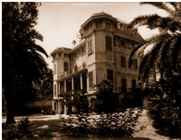
ویلای نوبل در «سانرمو»

«نوبل» در ویلای خود در «سانرمو» در ایتالیا در تاریخ ۱۰ دسامبر سال ۱۸۹۶ زندگی را بدرود گفت. او از مرگ هراس بسیار داشت و در زمان حیاتش نیز، این هراس را به تماشا گذاشته بود. وی درست در حالی مرد که اطرافیانش را، پزشک مخصوص و کارکنانش تشکیل می‌دادند، بی آنکه دوست و آشنایی در کنارش حضور داشته باشد. ماده‌ی «نیتروگلیسرین» نیز تا آخر زندگیش با وی بود، زیرا که در آن زمان، دچار حمله‌ی قلبی شده بود و پزشک آن را به عنوان دارو، برایش تجویز کرده بود.